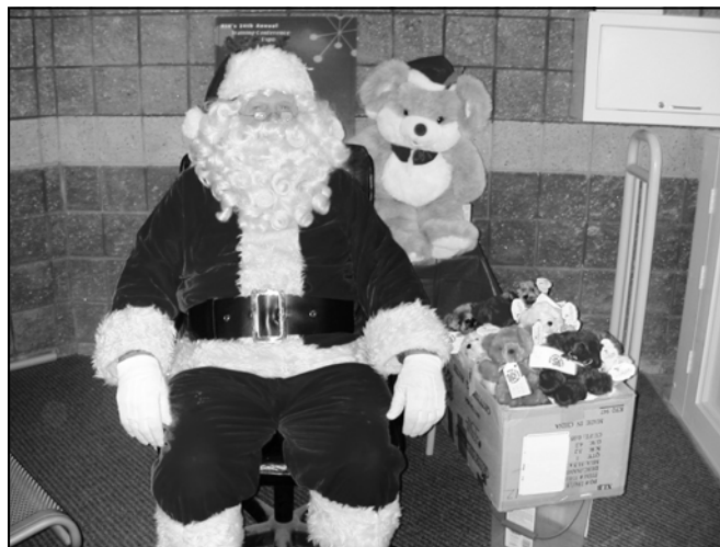
Muchas Gracias Santa!!