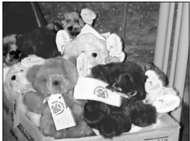
Los osos de peluche fueron donados por “Hugs Across America” y fueron dados a cada nino que vino de visita.